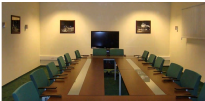
Sala nr 1

Zapraszamy do skorzystania z naszej oferty wynajmu.