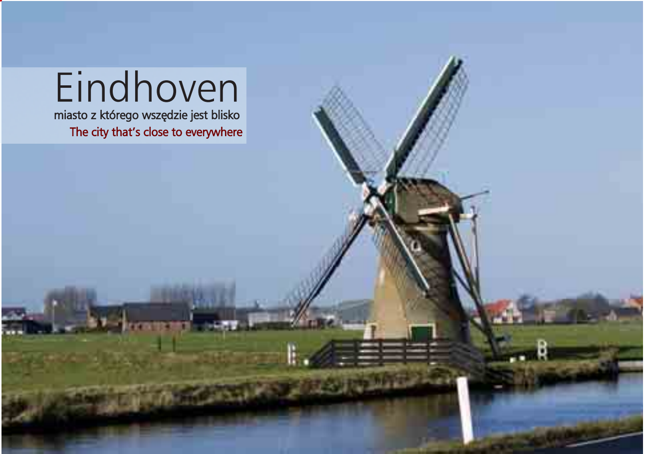
Stary młyn / Old Mill

miasto z którego wszędzie jest blisko The city that's close to everywhere