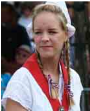
Dziewczęta na targu serów, Edam Girls at Cheese Market, Edam

As for kids – Eindhoven has many things for them too – but above all, the Burgers' Zoo. In ordinary zoos, people wander from cage