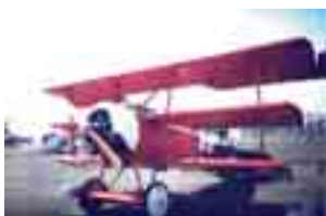
Fokker Dr1, triplane - ulubiony samolot myśliwskiego asa I wojny światowej Manfreda von Richtofena, "Czerwonego Barona" Fokker Dr1, triplane, favourite fighter plane of World War I great, Manfred Von Richtofen 'The Red Baron'

ILA to nie tylko rozmowy handlowe, ale również wielki festyn lotniczy. Ostatnie trzy dni są dostępne dla szerokiej publiczności. Organizatorzy oceniają, że przez weekend przez lotnisko przewinęło się ponad 250 tys. ludzi. Przez cały dzień odbywały się pokazy w powietrzu. Można było zobaczyć zarówno najnowsze konstrukcje cywilne i wojskowe, a także historyczne maszyny. Ponieważ niedawno minęła kolejna rocznica mostu powietrznego po zablokowaniu Berlina Zachodniego przez Rosjan, obył się salut pamięci. Nad lotniskiem przeleciały C-47 Dakota, Junkers Ju52 oraz P-51 Mustang. Młodszym czytelnikom przypomnę, że przez 11 miesięcy od czerwca 1948 r. do maja 1949 r., po zamknięciu wszystkich szlaków wodnych i lądowych to właśnie samolotami dostarczano wszelkie niezbędne towary potrzebne do funkcjonowania miasta, w tym i węgiel. Był to największy most powietrzny z pomocą humanitarną w historii.