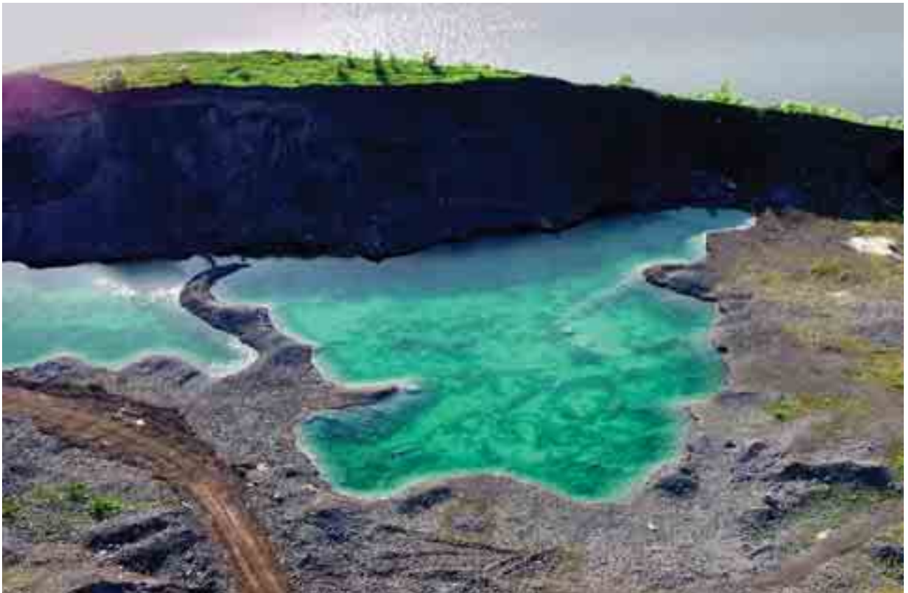
Turkusowy brudas / Turquoise shallows

góry, cudowne gęste lasy o wielkiej powierzchni, masę czarujących jezior, przepiękne rzeki, pustynię Błędowską, Jurę Krakowsko-Częstochowską oraz niesłychane zagęszczenie obiektów przemysłowych, których znaczną część stanowią niezwykle dzieła architektury przemysłowej. Dzięki tej różnorodności mam nieskończone wręcz możliwości pokazywania naszego regionu z różnej perspektywy.