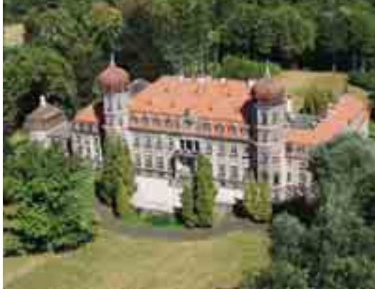
Pałac w Brynku / Brynek Palace