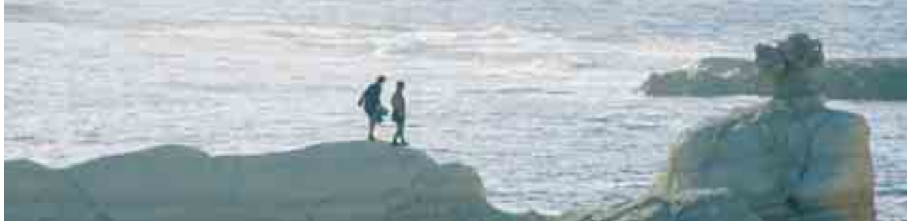
Paphos, Cypr / Paphos, Cyprus