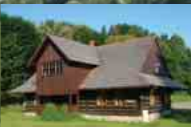
Enklawa starego budownictwa An enclave of heritage buildings