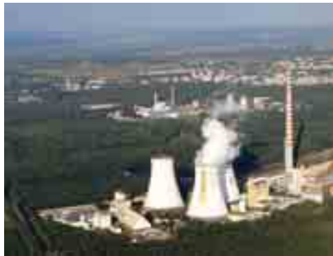
Elektrownia / Power plant