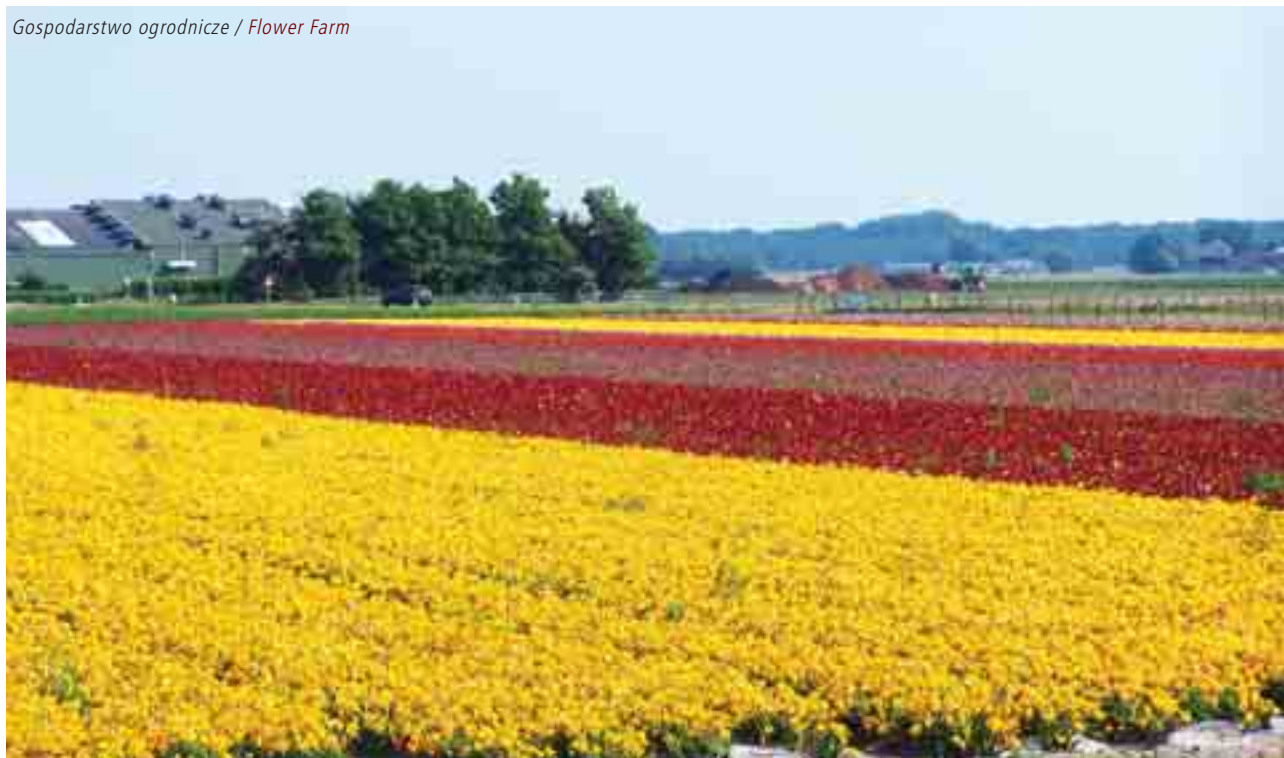
Gospodarstwo ogrodnicze / Flower Farm

Andrzej Wiktorowicz