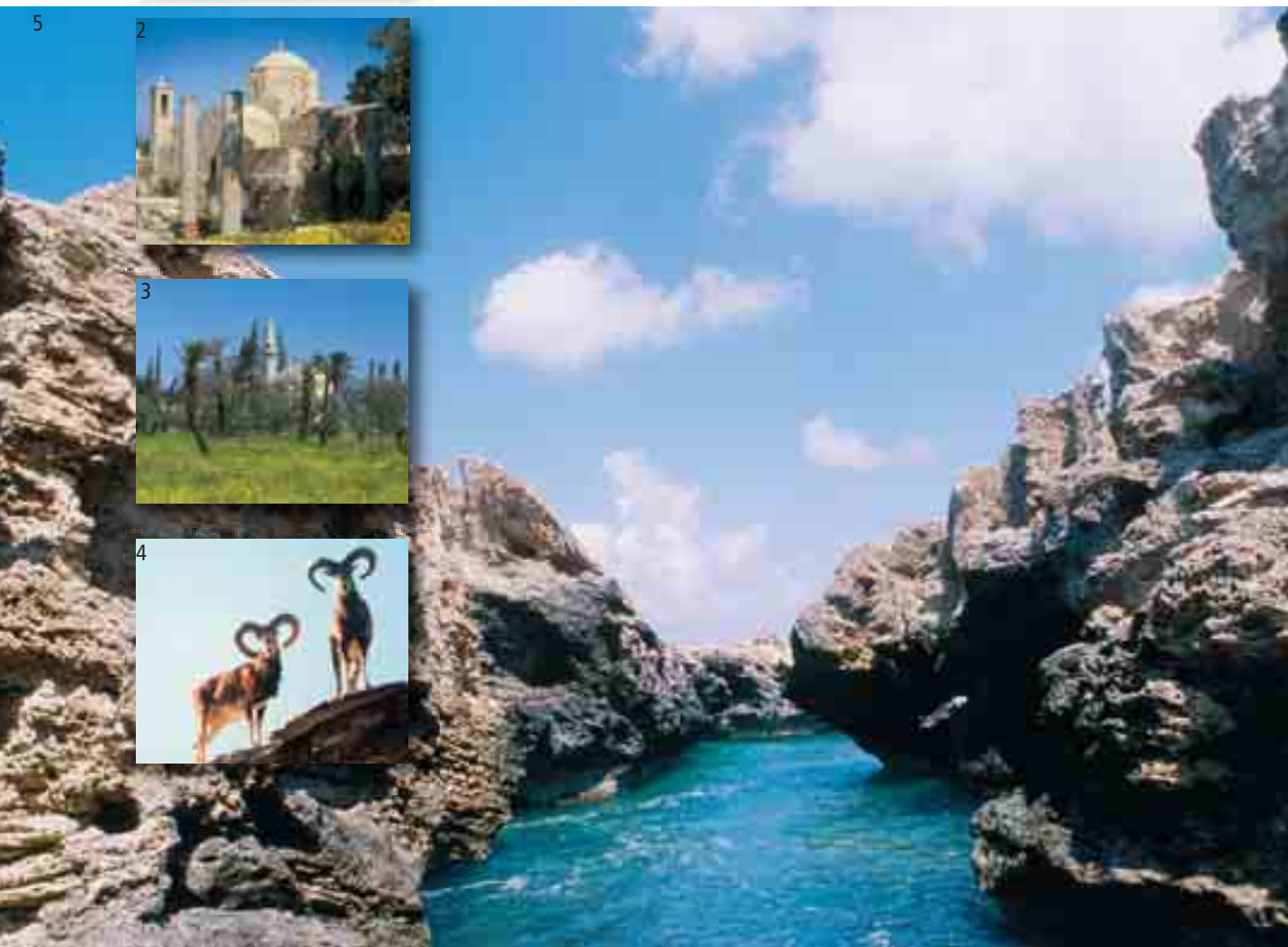
1. Mozaika „Leda z łabędziem” / Mosaic of Leda and the swan 2. Meczet Hala Sultan Tekke / Hala Sultan Tekke Mosque 3. Kościół Panagia Chrysopolitissa / Panagia Chrysopolitissa Church 4. Muflony / Mouflons 5. Półwysep Akama / Akama Peninsula

Dla każdego początkującego Indiana Jones Cypr to konieczność! Wymarzony kąsek dla archeologów z uwagi na bogatą i burzliwą historię oraz wiele tajemnic, leżących jeszcze głęboko w ziemi i czekających na odkrycie (2300 r. p.n.e. – początek epoki brązu: obecność ludności na Cyprze została udokumentowana wykopaliskami znalezionymi w grobach niedaleko Morfu). O skarbach ukrytych na wyspie świadczy także geneza jej nazwy: pochodzi od łacińskiego słowa „cuprum” oznaczającego „miedź”, której Cypr był w starożytności głównym dostawcą.