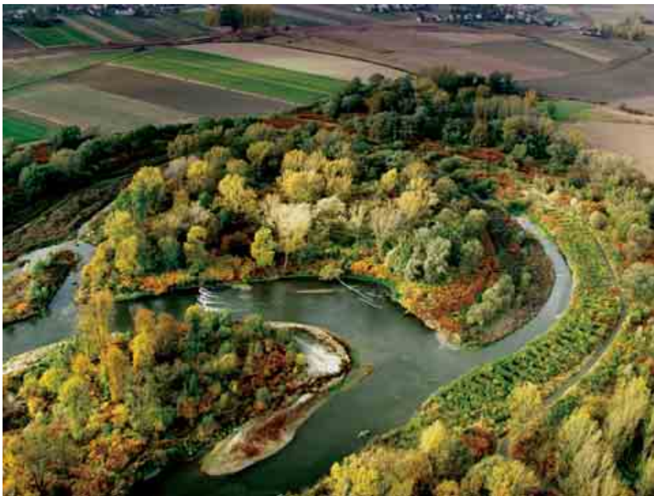
Meandry / Meandering river

PA: Skąd ta fascynacja podniebnymi zdjęciami?