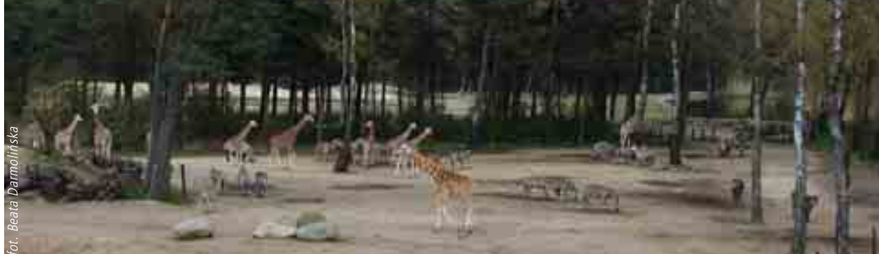
Ogród zoologiczny Burgers' Zoo / The Burgers' Zoo

jąc znużone niedźwiedzie, tępo żujące trawę zebry lub zirytowane małpy. W Eindhoven to zwierzęta są „gospodarzami” sektorów zoo, w których żyją swobodnie w warunkach imitujących naturalną dżunglę, sawannę, pustynię, a nawet świat oceanu. Człowiek jest ich gościem, a jego obcowanie tutaj ze światem fauny zapewnia mu wiele atrakcji. Przyjemność to dość droga (bilety ok. 15-18 euro), ale przeżycie jedyne w swoim rodzaju.