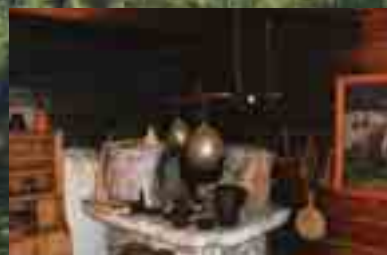
Chata Kocyana Kocyana's Cottage