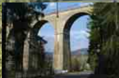
Wiadukt w Łabajowie The viaduct in Łabajów