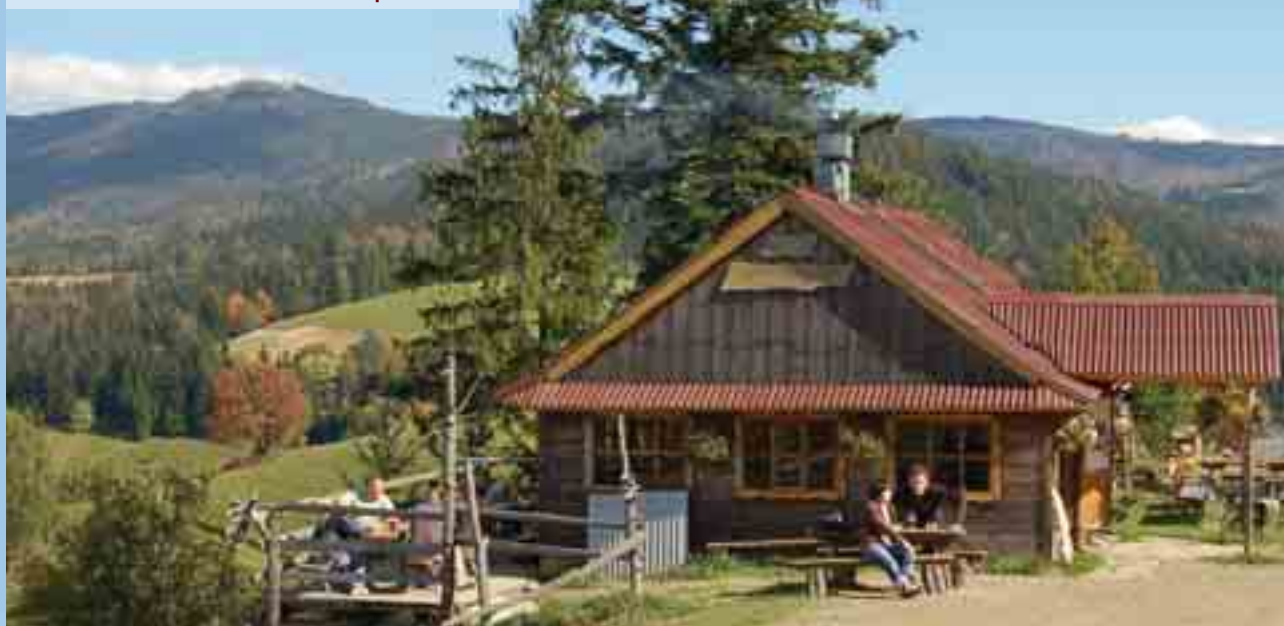
Drzewionka na Cieńkowie / Traditional wooden house in Cieńków

Uwaga, uwaga! Zbliżamy się do Perły Beskidów – miasta, które ofiarowuje wymarzony wypoczynek miłośnikom aktywności, ale również szukającym wytchnienia z dala od zgiełku. Wisła to obowiązkowy przystanek każdego turysty. Daje tak wiele w zamian za tak niewiele. Oczekuje jedynie otwartości na niespodzianki, wrażliwości na piękne widoki i chęci przeżycia niezapomnianej przygody. Każdy, kto zatrzyma się w Wiśle na chwilę, będzie chciał zostać tu na dłużej.