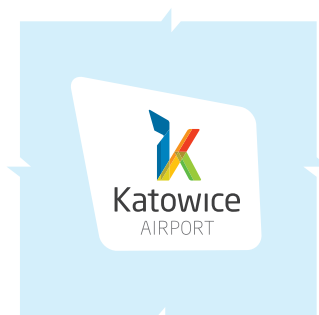
winieta 1 – wersja monochromatyczna